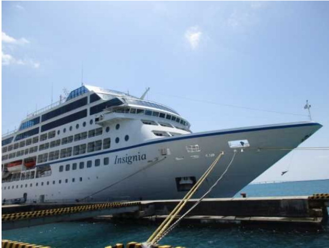
下崎ふ頭に停泊した「インシグニア」

初寄港に併せて行われた歓迎セレモニーでは、ミス宮古島らによる花束贈呈のほか、記念品の贈呈や宮古島の民謡ショーで一行を歓迎しました。