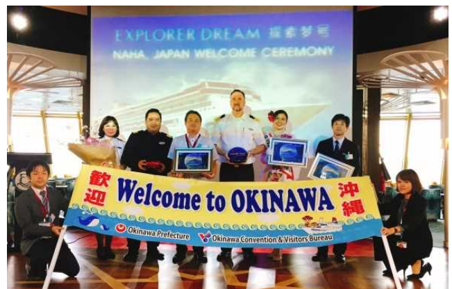
那覇港で行われた歓迎セレモニー