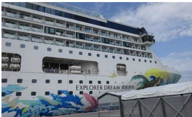
石垣港に寄港した「エクスプローラー・ドリーム」

・平成31年3月30日（土）石垣港新港地区クルーズターミナルに、翌4月1日（月）那覇港クルーズターミナルにドリームクルーズ社所属の「エクスプローラー・ドリーム」（75,338GT）がそれぞれ初寄港しました。両港では初寄港を歓迎するセレモニーが行われ、花束贈呈や記念楯の交換が行われました。なお、石垣港への寄港は同船として国内初寄港となりました。