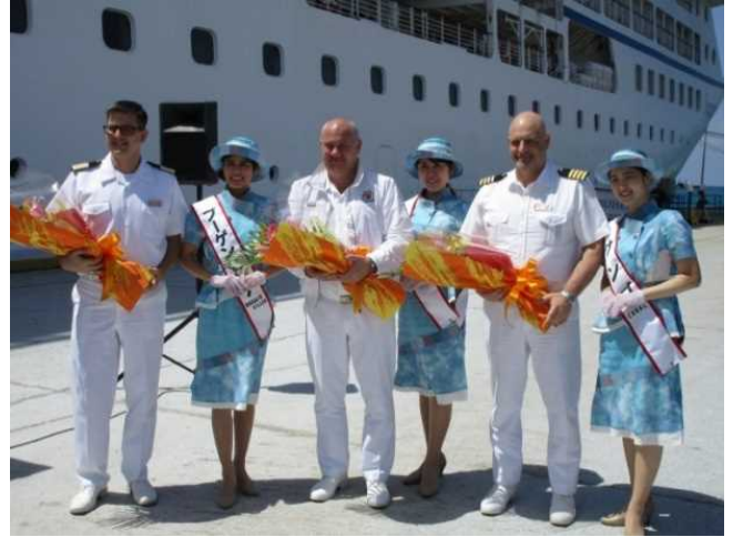
ミス宮古島より花束贈呈

・平成31年3月30日（土）石垣港新港地区クルーズターミナルに、翌4月1日（月）那覇港クルーズターミナルにドリームクルーズ社所属の「エクスプローラー・ドリーム」（75,338GT）がそれぞれ初寄港しました。両港では初寄港を歓迎するセレモニーが行われ、花束贈呈や記念楯の交換が行われました。なお、石垣港への寄港は同船として国内初寄港となりました。