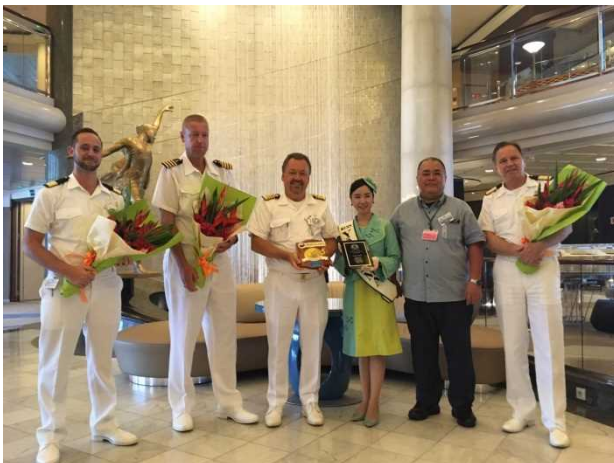
石垣港での歓迎セレモニー