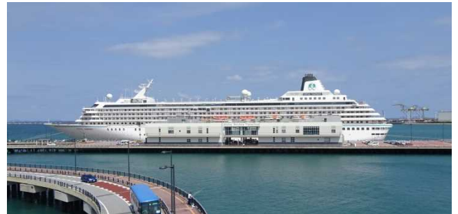
那覇港に初寄港した「クリスタル・シンフォニー」

・クリスタル・クルーズ社所属のラグジュアリークラス「クリスタル・シンフォニー」(51,044GT)が5月14日(火)に石垣港、翌15日(水)には那覇港に相次いで初寄港し、両港では初寄港を歓迎するセレモニーが行われました。