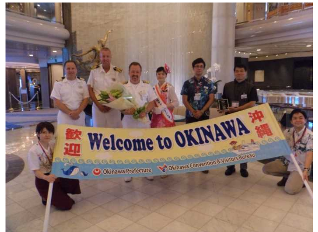
那覇港での歓迎セレモニー