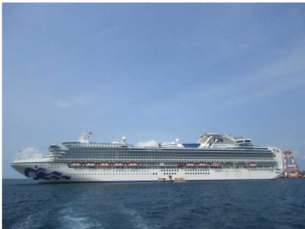
平良港に初寄港した「ダイヤモンド・プリンセス」

・プリンセス・クルーズ社所属のプレミアムクラス「ダイヤモンド・プリンセス」(115,906GT)が5月14日(火)に平良港へ初寄港し、日本人を中心とした2,666名の乗客が宮古島観光を楽しみました。船内で行われた歓迎セレモニーでは花束や記念品が贈呈され、宮古島の民謡ショーで一行を歓迎しました。