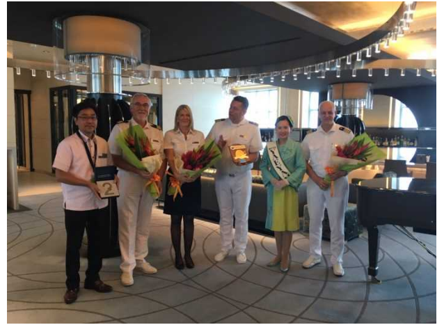
石垣港での歓迎セレモニー

・クリスタル・クルーズ社所属のラグジュアリークラス「クリスタル・シンフォニー」(51,044GT)が5月14日(火)に石垣港、翌15日(水)には那覇港に相次いで初寄港し、両港では初寄港を歓迎するセレモニーが行われました。