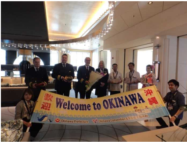
那覇港での歓迎セレモニー