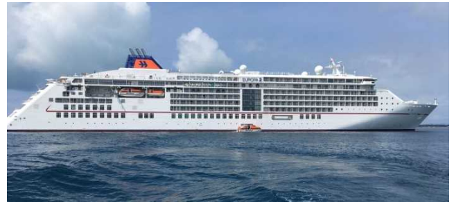
石垣港に初寄港した「オイローパ2」

・ハパグロイド・クルーズ社所属のラグジュアリークラス「オイローパ2」(42,830GT)が5月13日(月)に那覇港へ、翌14日(火)に石垣港に初寄港し、両港では初寄港を歓迎するセレモニーが開催され、花束の贈呈や記念品の交換が行われました。