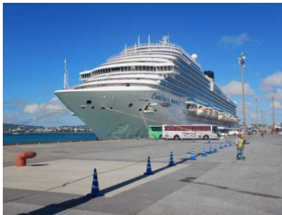
コスタ・ベネチア(船頭)