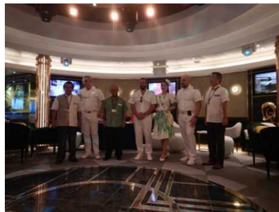
セレモニーでの記念撮影