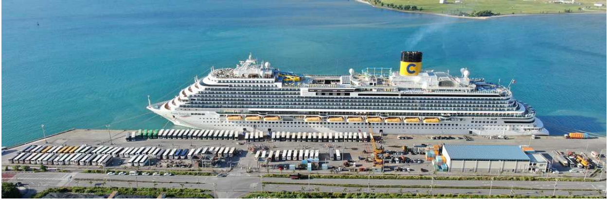
中城湾港へ寄港した「コスタ・ベネチア」

・ コスタ・クルーズ社所属の「コスタ・ベネチア（135,500GT）」が9月12日、中城湾港に初寄港しました。県内で2港目の寄港となった今回のツアーでは、上海からの観光客5,121名がツアーバス等を利用して中部地域の観光地を巡りました。