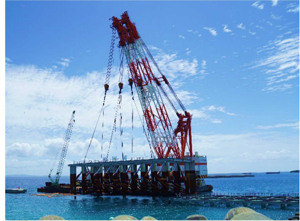
ジャケットを取り付ける様子