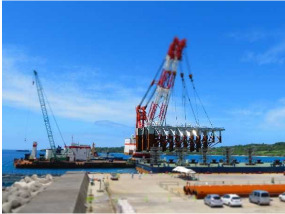
ジャケットをつり上げる様子

今後はジャケット上部への床板の設置や舗装工などが施される他、網とりのドルフィンの整備など、早期の供用に向けて引き続き整備が進められます。