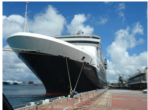
那覇港へ寄港した「マースダム」