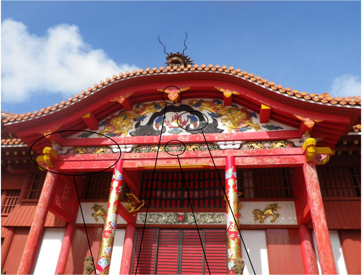
【 首里城正殿外部の漆塗装・彩色の劣化、金箔の剥がれの状況 】