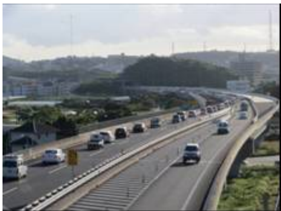
南風原南 IC 付近の交通混雑（豊見城東方向撮影） 豊見城 IC 付近の交通混雑（平良CCTV 画像）