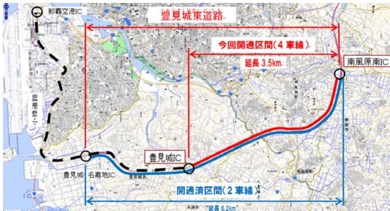
整備状況図(豊見城市金良付近)