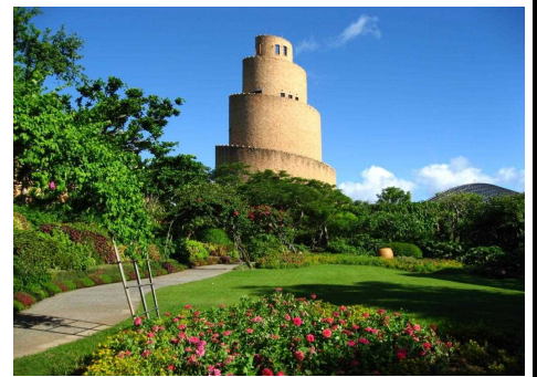
熱帯ドリームセンター

昭和 51 年 8 月 1 日の開園以来、約 38 年で入園者数 8,000 万人を迎えることとなりました。これもひとえに、海洋博公園を愛しご利用くださるお客様と、日頃よりご支援とご協力をくださる皆様方のおかげと心より感謝いたしております。