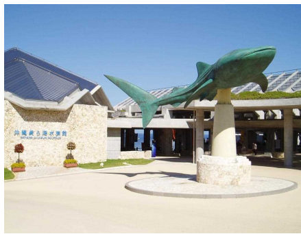
沖縄美ら海水族館