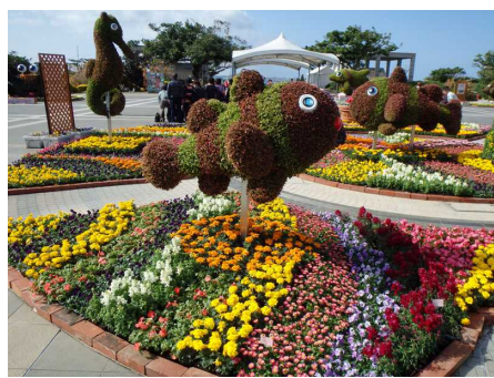
噴水広場 (花まつりの様子)

日頃より海洋博公園の運営にご協力いただき、誠にありがとうございます。 まもなく、海洋博公園の 入園者数が 8,000 万人に達する見込み となりましたのでお知らせします。