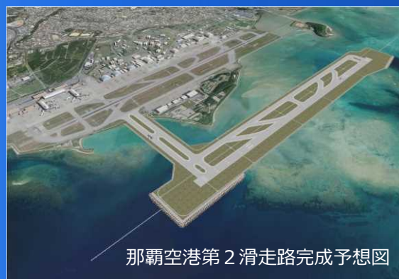
那覇空港第2滑走路完成予想図