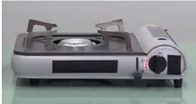
図 3 カセットこんろのイメージ