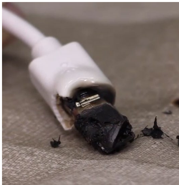
図 5 焼損した充電ケーブルのコネクターのイメージ