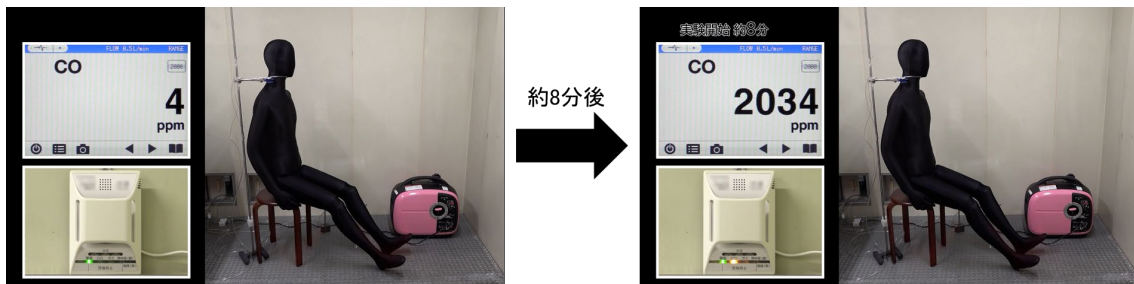
図 2 室内で携帯発電機を使用した際の一酸化炭素中毒

当該製品に異常は認められず、換気が十分に行えない屋内で使用したため、排気ガスにより屋内の一酸化炭素濃度が上昇し、一酸化炭素中毒になったものと推定される。なお、本体及び取扱説明書には、「排気ガス中毒のおそれあり。」「屋内など換気の悪い場所で使用しない。」旨、記載されている。