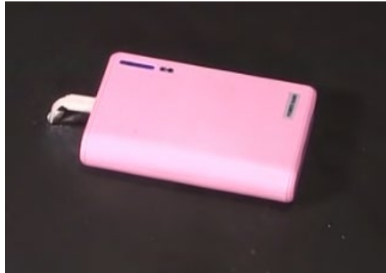
図 4 モバイルバッテリーのイメージ

簡単に手で持ち運べるサイズの製品もあり、非常に身近な存在です。 一方で、一定数の事故(火災)が毎年発生していますので、以下の注意点に従って、安全にご利用ください。