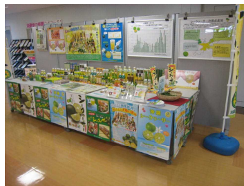
(シークワサーの商品展示)