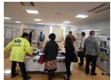
(農業農村整備のパネル展)