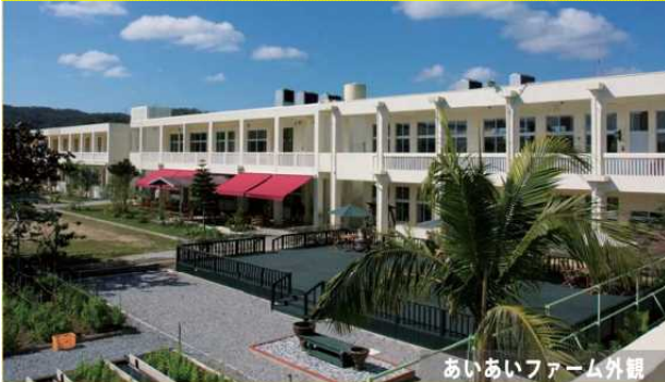
廃校を活用した農家レストラン及び宿泊施設