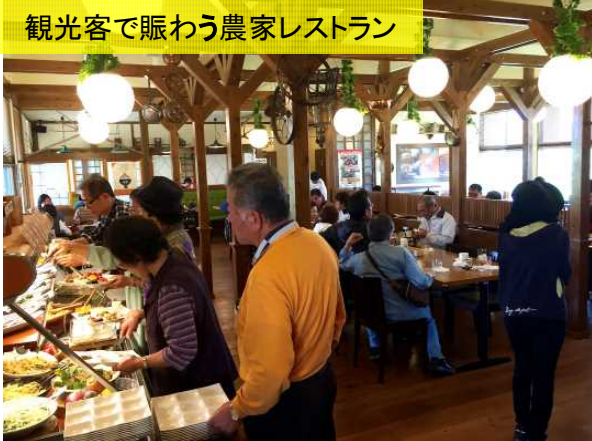
観光客で賑わう農家レストラン