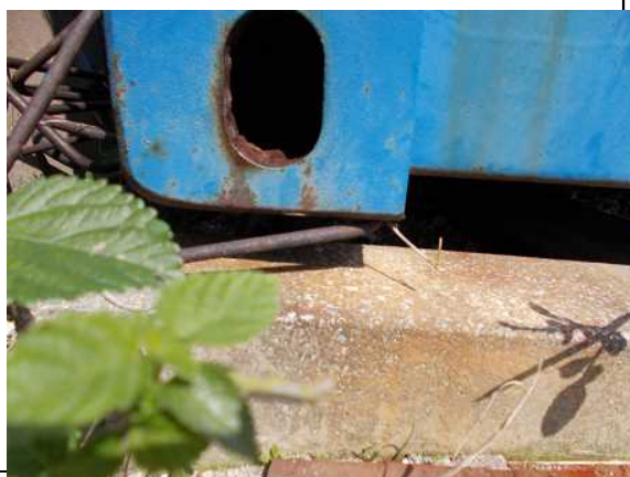
角床の浮き上がりが見られる。