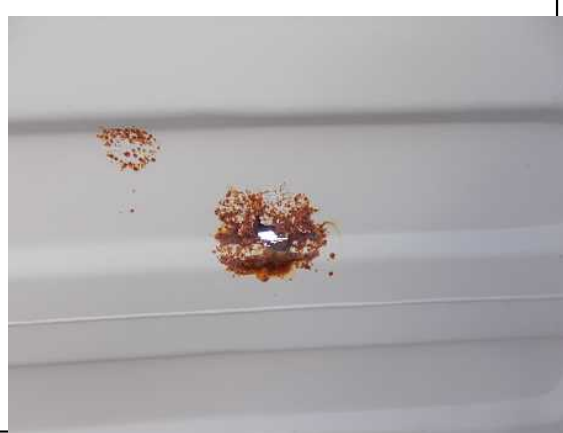
破孔がみられ、内部に漏水。