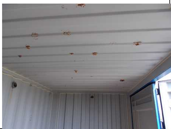
天井に腐蝕が進み、内部にも露出している