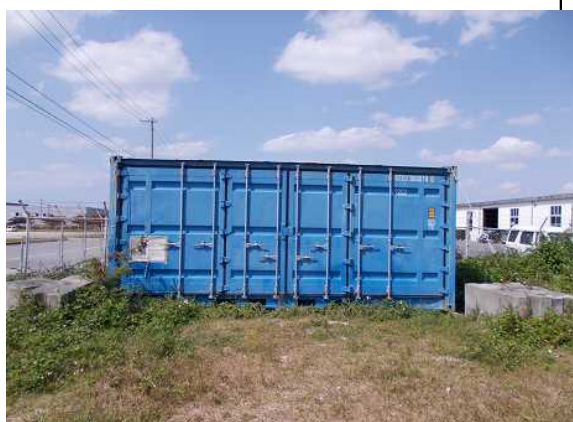
コンテナ正面: 傾斜が見られる。