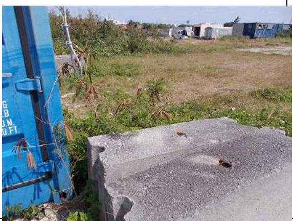
ワイヤーの腐蝕がすすみ、断裂している。