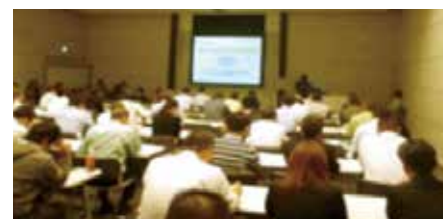
(昨年度の講習会の様子)