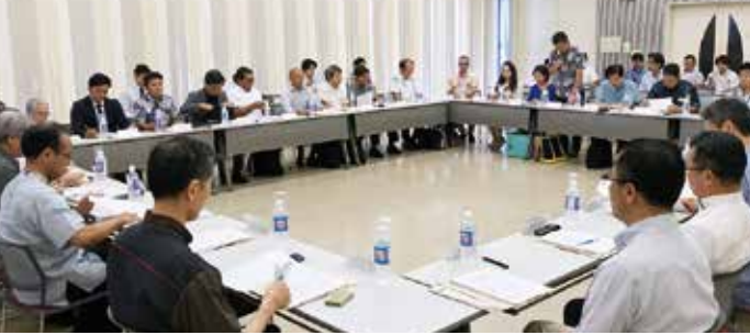
▲第3回運営会議第一部の様子

第1部では、平成29年度事業報告や、平成30年度沖縄スポーツ産業クラスター形成事業計画などについて審議し、了承されました。その結果、本年度から、これまで「万国医療津梁協議会」にお