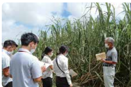
さとうきびほ場での現地調査の様子