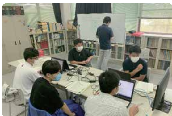
土地改良総合事務所における業務説明の様子

実習生は、各受入先から業務概要の説明を受けた後、地下ダムの水質測定や水質データの解析、さとうきびの生育状況や養鶏農家の経営状況に関する現地調査などを行いました。また、最終日には、各受入先で実習成果発表会が開かれ、実習生から業務体験や現地調査などを通じて得られた成果や課題などについて発表が行われました。