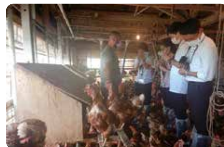
養鶏農家での現地調査の様子

お問合せ先 農林水産部 農政課 ☎098-866-1627 農林水産部 農村振興課 ☎098-866-1652