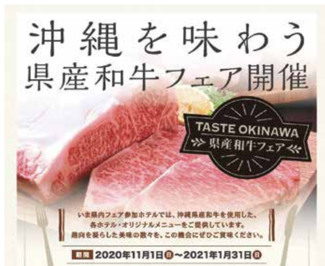
「TASTE OKINAWA 県産和牛フェア」のチラシ

フェア期間中は、沖縄県ホテル協会加盟の14ホテルにおいて、県産和牛肉を使った各ホテルオリジナルの食事メニューがお手頃価格で提供されています。この機会に、ぜひ県内ホテルに足をお運びいただき、県産和牛肉を味わってください。