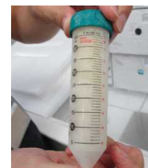
カイコからの抽出液