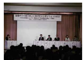
昨年のシンポジウムの様子