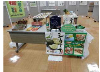
(シークワサー、黒糖の展示)