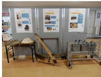
(農機具とパネル展示)