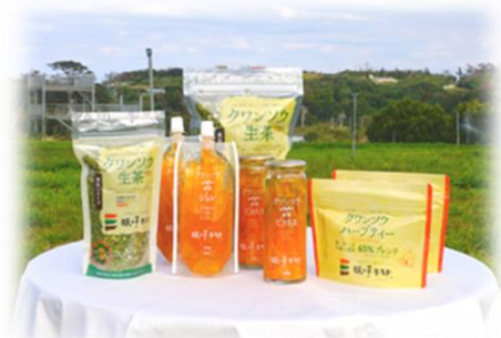
クワンソウ関連商品